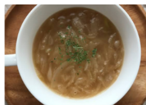
オニオンスープ Onion Soup