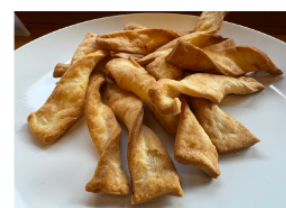
自家製クラッカー Homemade Crackers