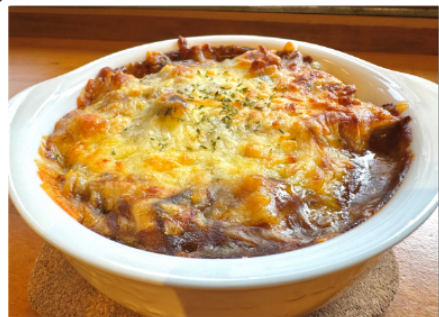
信州きのこの焼きカレー(ライス付き)

Shinshu Mushroom Baked Curry (Rice included)